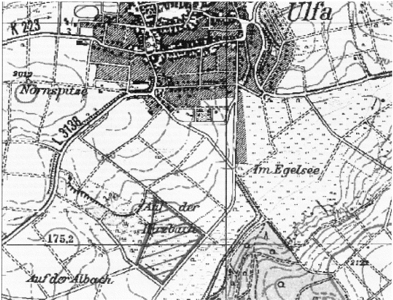
Karte: Schraffierte Fläche des Betretungsverbots vom 06. April bis zum 30. Juni 2011