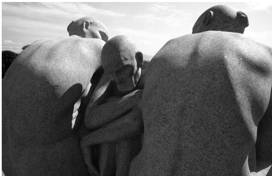
Vigeland Park Oslo

Gemeinschaft und soziale Kontakte stehen im Vordergrund.