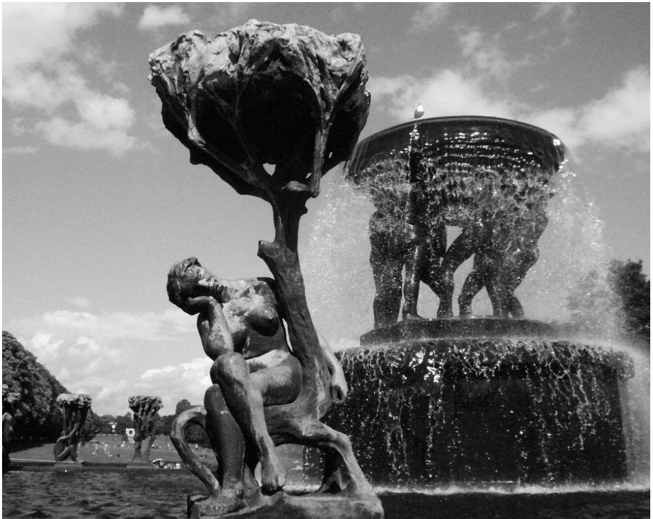
Vigeland Park Oslo

Teilnehmen können alle, die ambulante oder teilstationäre Hilfen speziell für demenzkranke Menschen und deren Angehörige anbieten oder ein solches Angebot in absehbarer Zeit planen.