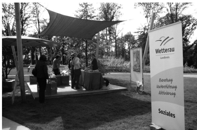
Infotag – Demenz – Landesgartenschau Bad Nauheim