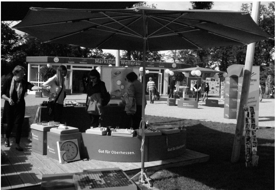
Infotag – Demenz – Landesgartenschau Bad Nauheim

Termin: Jeden ersten und dritten Samstag im Monat von 11 bis 14 Uhr telefonisch, persönlich, anonym!